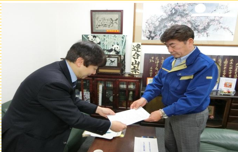
■ 連合山梨中澤会長（右）に要請を行う佐保労働基準部長