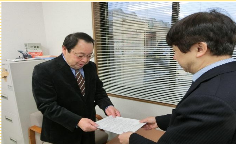
■ 山梨県労働基準協会連合会横内専務理事（左）に要請を行う佐保労働基準部長