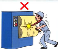
はさまれ・巻き込まれ災害