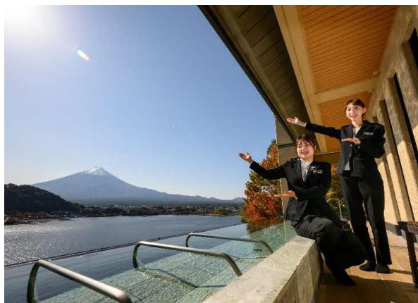
展望大浴場「大空の湯」