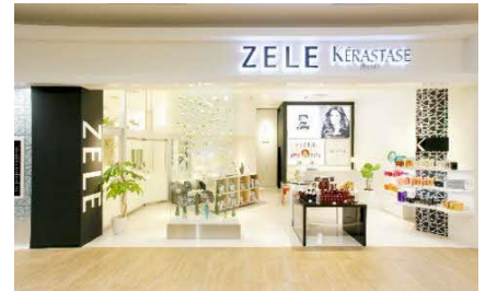
ZELEイモール甲府昭和(昭和町)

山梨県内に8サロン! (甲府市、甲斐市、昭和町、都留市、大月市、富士吉田市、河口湖町)