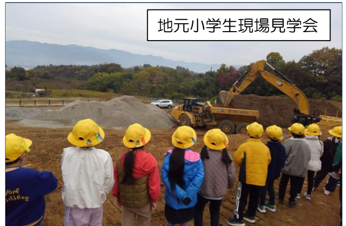
地元小学生現場見学会