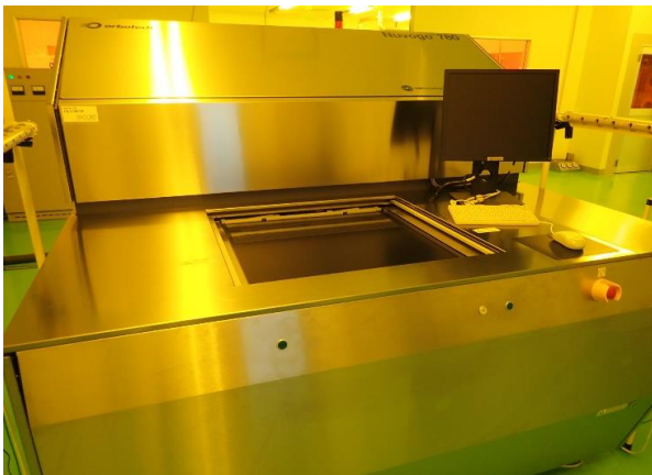
最新鋭設備・ダイレクト露光機