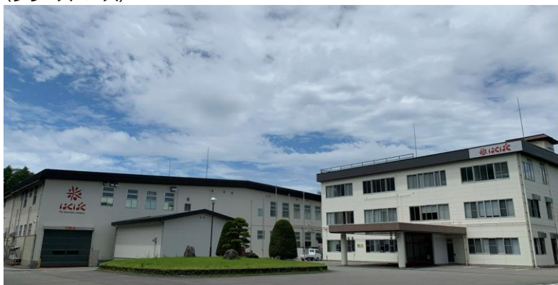
▲はくばく富士吉田 (左:工場棟・右:事務所棟)