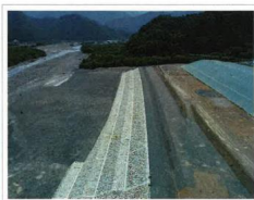
R2 粟倉地区改良(その5)工事