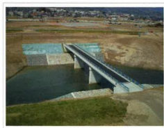
増穂第3環境整備工事