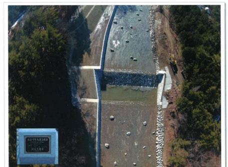
石空川中流第3床固工事