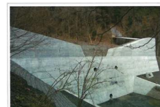
唐沢砂防堰堤補強工事