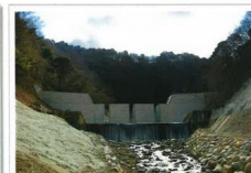
石空川第2砂防堰堤工事