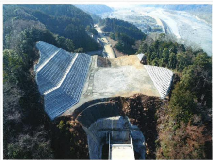
中部横断南部和田地区改良保安工事