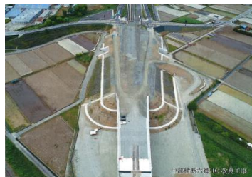
中部横断六郷IG改良工事