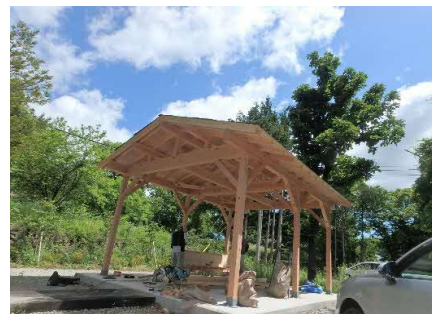
バーベキュー施設建築 現場管理