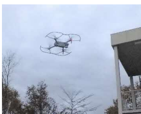
現場でドローン撮影