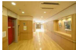
ショートステイ 10床 居宅介護支援事業所