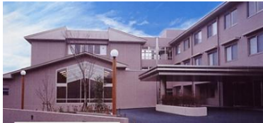
特別介護老人ホーム 60床 デイサービス 定員50名/日