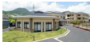
地域密着型特別介護老人ホーム 29床 デイサービス 定員45名/日