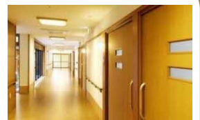
ショートステイ 10床 居宅介護支援事業所