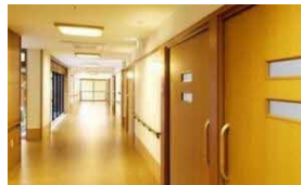
ショートステイ 10床 居宅介護支援事業所