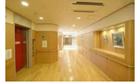
ショートステイ 10床 居宅介護支援事業所