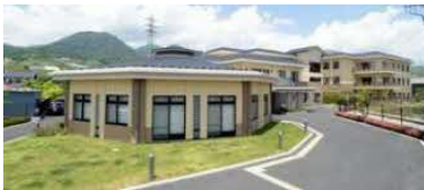
地域密着型特別養護老人ホーム 29床 デイサービス 定員45名/日