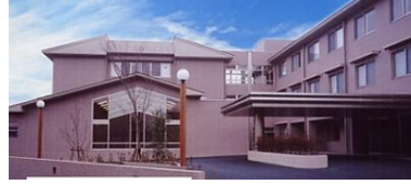
特別養護老人ホーム 60床 デイサービス 定員50名/日