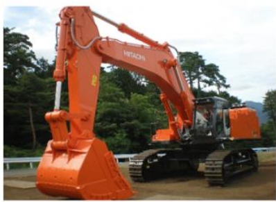
日立建機製建設機械