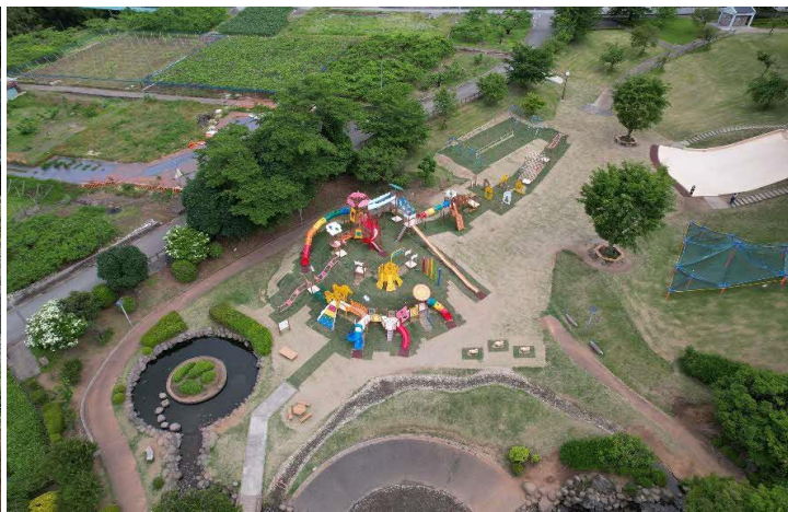
令和5年度 ふるさと公園遊具更新工事