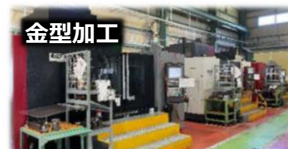
【CAM マシニングセンタ】