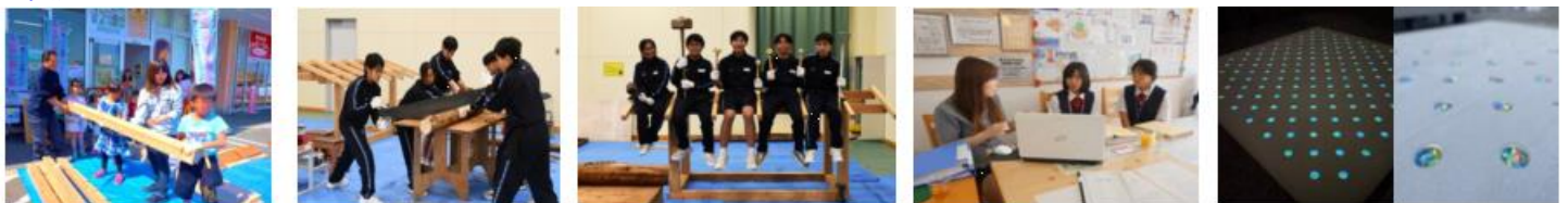
(3歳から6歳児による) 子供上棟式(左) 中学生の職場体験(中2枚) 高校生の職場 ドットコンクリート(夜光石)

イトウ@ホームでは、受け継がれる【棟梁精神のDNA】のもと「家族参加型の家づくり」「信頼できる工務店」「地域と社会に貢献する」の3つの理念を柱として経営してます。弊社の商品は主に、デザイン住宅・耐震住宅リフォーム・外構を施工しております。①新築は、プライベートブランド「konomiこのみ」や100%オーダーメイドエコ住宅のお家をご提供致します。②リフォームでは、お客様のニーズによる問題解決やお困りごとに敏速に対応します。③外構では、山梨県下初水害から子供たちの将来を守るドットコンクリートの導入・ガーデニング・カーポート・家庭菜園・エクステリア等お客様おひとりに合ったプレゼンサービスを提供致します。何事にも積極的に頑張る・若さとアイデアが溢れる人材を今回、募集致します。建築になじみのない方でも安心して働けます。それは、長く勤めているスタッフも未経験で入社しました。ZOOM等のセミナーもあり、社内研修が充実しています。前向きに頑張ってくれる方を募集しています。チラシ作りやお客様へのお礼状・お温かみのあるお手紙など手描きにこだわっています。また、SNSはもちろん、動画など活用した会社PRにも力を入れております。もの造りに興味のある方も大歓迎です。若い方や子育て中の方も働きやすい職場環境を整えています。定期的に社内で働き方改革を実施し、相談窓口の設置・面談日の設定・ノー残業デーの推進を行っております。社内掲示もばっちりです！ものづくりに興味のある方(DIYに拘りません)絵心のある方・お洒落心に関心のある方・お料理好きな方・趣味をお持ちの方・・・皆さん手に職を付けませんか？そして、自分らしさのお仕事を生かした”OSHIGOTO”好きにならしましょう!!(代表より一言)弊社は、お陰様で創業20周年を迎えます。職人派社長が、無名のZEROの時代から会社を立ち上げ、リーマンショック・コロナ過・ウッドショック・建築資機材の価格高騰など、いくつもの危機を経験して現在に至っております。創業以来お客様より、ユニークさなどから支持を頂いております。！入社後、研修期間中は、私に同行して頂き、会社内の業務を体感して頂き仕事を覚えて頂きます。今後のご参考になる為に、ぜひ会社訪問を活用しましょう！イトウ@ホームをみるほど、好きになりますよ・・・笑)