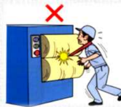
はさまれ・巻き込まれ災害