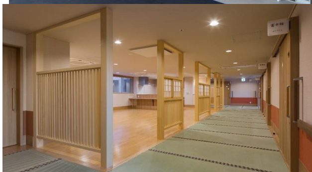
落ち着いた雰囲気施設の設内