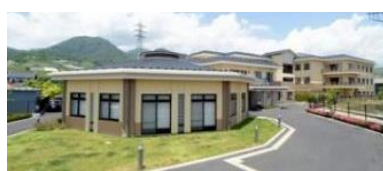
地域密着型特別養護老人ホーム 29床 デイサービス 定員45名/日