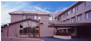
特別養護老人ホーム 60床 デイサービス 定員50名/日