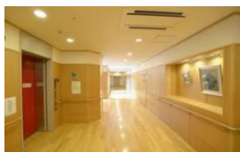
ショートステイ 10床 居宅介護支援事業所