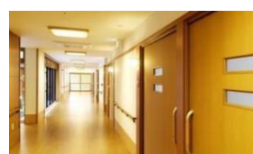
ショートステイ 10床 居宅介護支援事業所