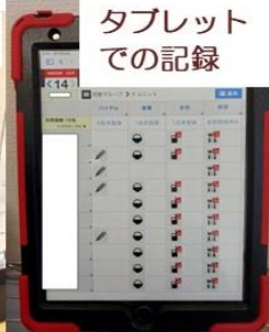
タブレットでの記録