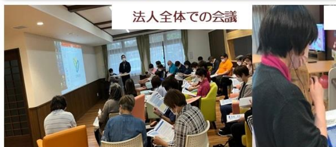
法人全体での会議