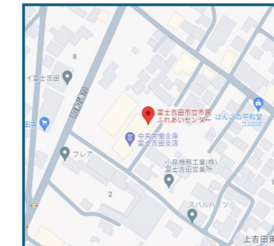
⑤富士吉田会場 (富士吉田市上吉田東3-1-77)