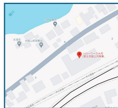
⑦大月会場 (大月市大月3-2-17)