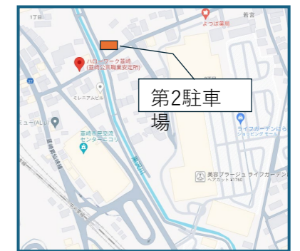
③韮崎会場 (韮崎市若宮1-10-41)