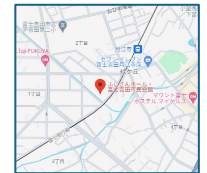
⑥富士吉田会場 (富士吉田市緑ヶ丘2-5-23)