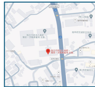
①甲府会場 (甲府市中小河原町403-1)