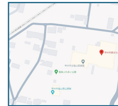
②塩山会場 (甲州市塩山上塩後240)