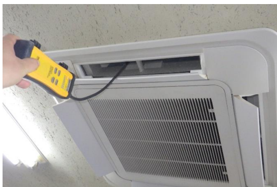
空調点検作業の様子