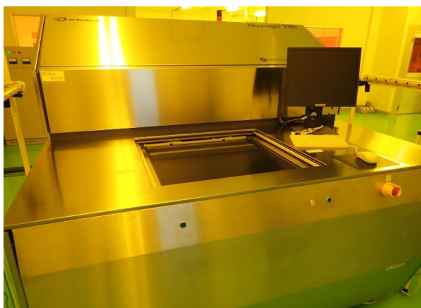
最新鋭設備・ダイレクト露光機