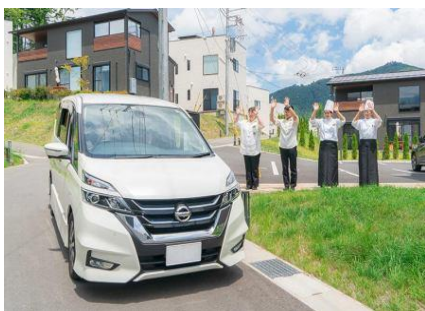
チェックアウト時のお見送り