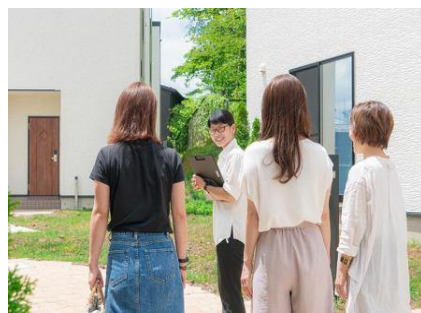
スタッフがお客様をお部屋にご案内している様子