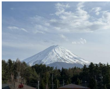
2024年開業予定施設からの富士山眺望