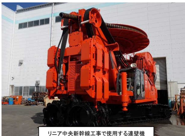
リニア中央新幹線工事で使用する連壁機