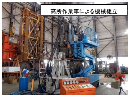
高所作業車による機械組立