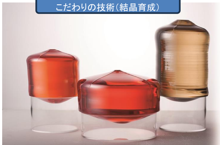
こだわりの技術(結晶育成)