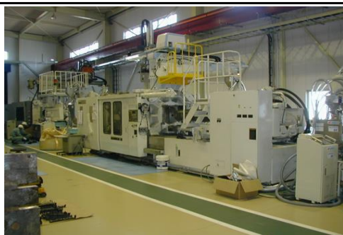
成形工場の成形機 完成した金型を取り付けて量産