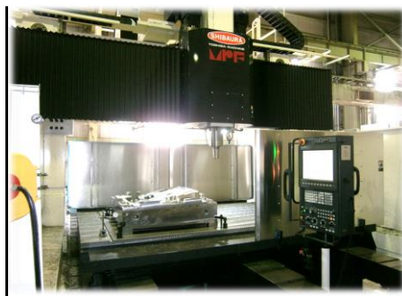
工作機械での加工