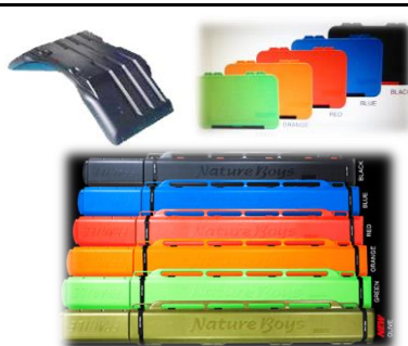
こんなプラスチック製品を 作ってます