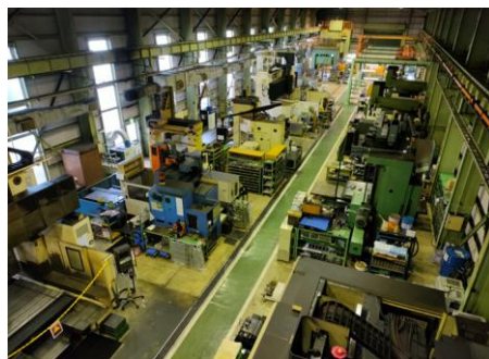
金型工場 各種工作機械が並んでいます