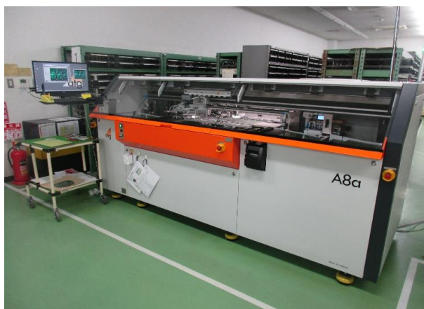
最新鋭設備・自動電気検査機