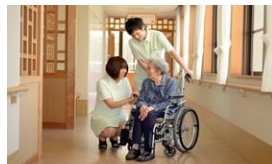
ショートステイ 20床