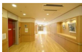
ショートステイ 10床 居宅介護支援事業所