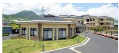
地域密着型特別介護老人ホーム 29床 デイサービス 定員45名/日