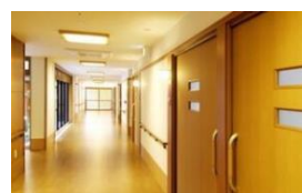
ショートステイ 10床 居宅介護支援事業所