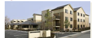
有料老人ホーム 70床