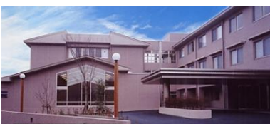
特別介護老人ホーム 60床 デイサービス 定員50名/日