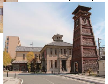
甲州夢小路(甲府駅)