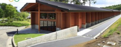
富士北麓公園 室内練習走路