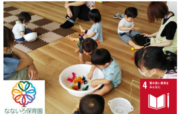
【なないろ保育園】(株)七保が運営する保育園