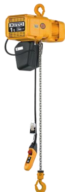
電気チェーンブロック