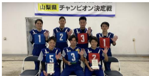
山梨県チャンピオン決定戦では表彰台の上位を独占しました！

穴水カーライフセンター を中心に 多様化するお客様のニーズに幅広くお応えし、 快適なカーライフのお手伝いをしています。