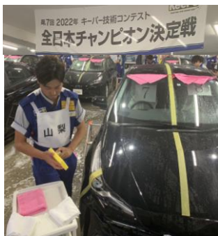
山梨県チャンピオンとして 全日本チャンピオン決定戦に出場！ 全国6位 に入賞しました