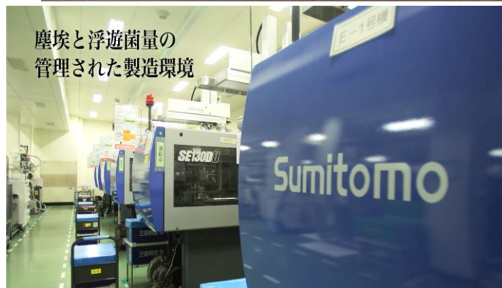
塵埃と浮遊菌量の 管理された製造環境