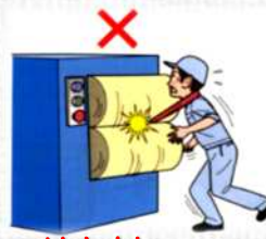
はさまれ・巻き込まれ災害