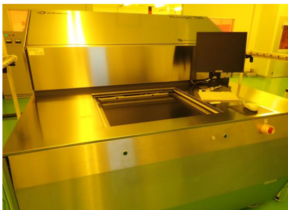
最新鋭設備・ダイレクト露光機