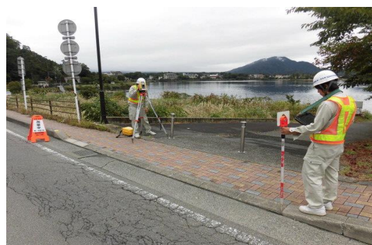
トランシット測量