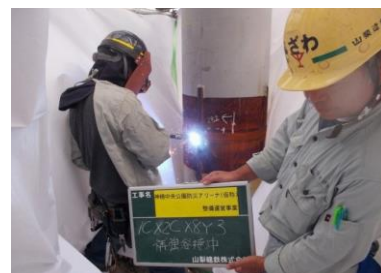
現場での溶接管理風景