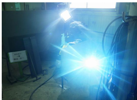
工場での溶接風景