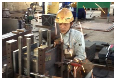
工場での組立て風景