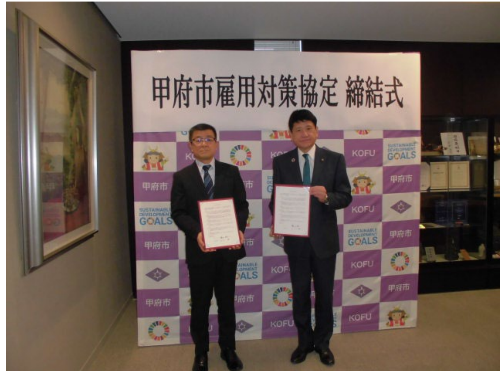
協定を取り交わした生方 勝 山梨労働局長 (左)と、樋口 雄一 甲府市長(右) 令和5年2月9日、締結式会場：甲府市役所