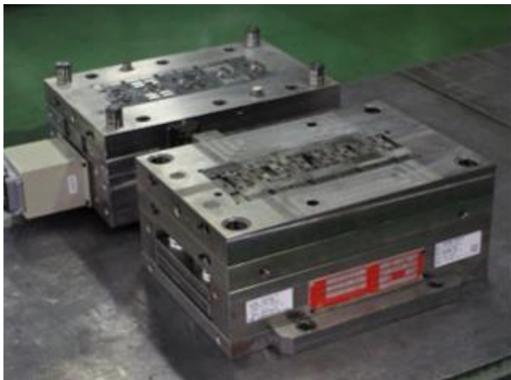
プラスチック金型