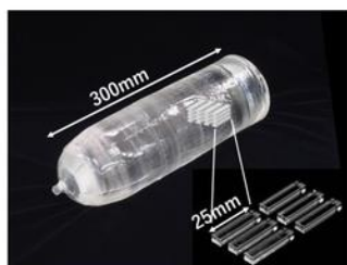
PET検査用単結晶製品