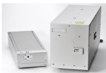
半導体ウエハ検査用レーザ製品