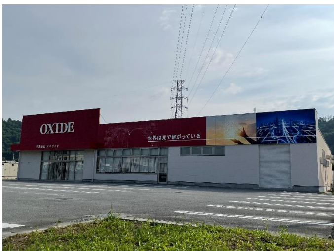
オキサイド 第6工場 (国道20号沿い)の外観