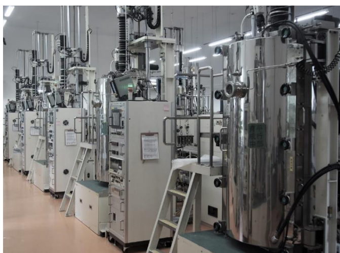
結晶育成装置の様子 当社では用途に応じ様々な単結晶を育成しています。