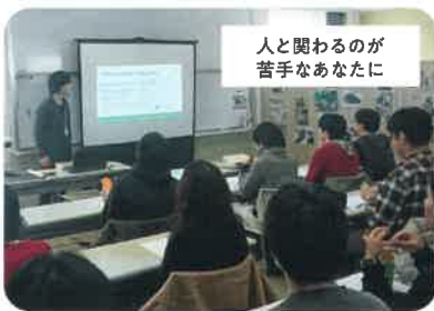
コミュニケーション講座