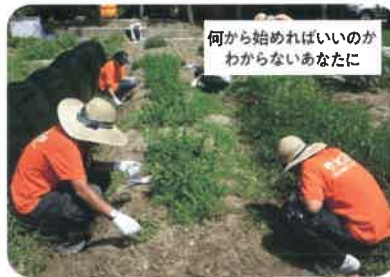
集中訓練プログラム