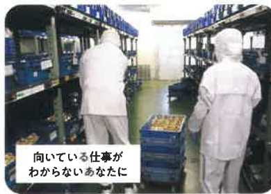
ジョブトレーニング