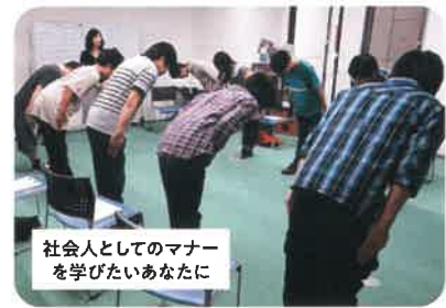
ビジネスマナー講座