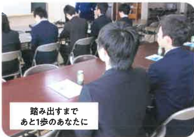
就活セミナー (面接・履歴書指導など)