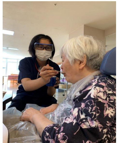
利用者さんへのケア