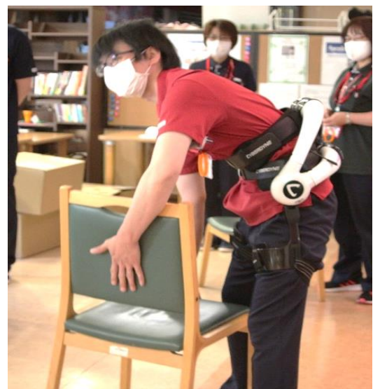
介護ロボットHAL導入