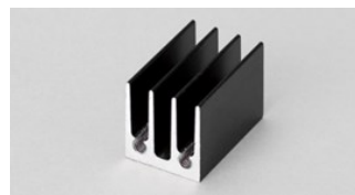
製品(ヒートシンク)