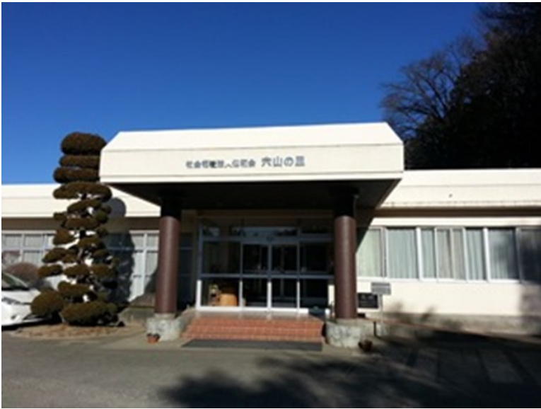
障害者支援施設穴山の里