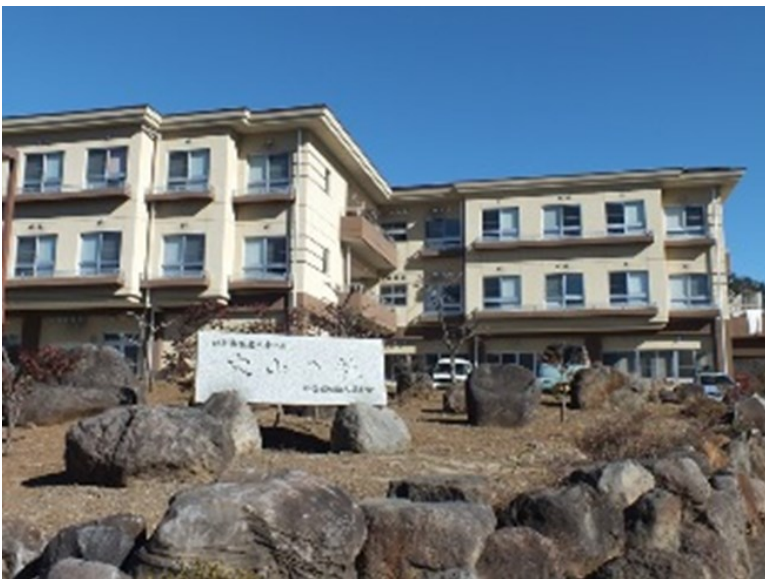
特別養護老人ホーム穴山の杜