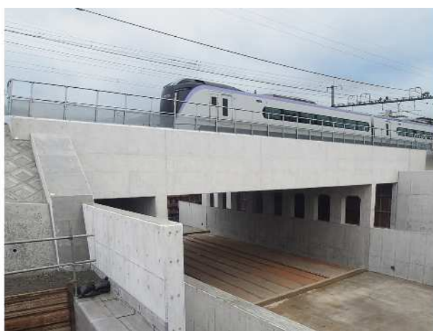
施工完了写真

山梨県内の建設業における労働災害の死傷者数は、各事業場の不断の努力により、平成28年以降4年連続100人程度で推移しています。山梨労働局では、平成28年度から「山梨県建設業ゼロ災宣言運動」を展開し、労働災害のさらなる減少に向け、その啓発に努めています。