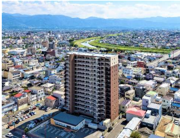
施工完了写真

山梨県内の建設業における労働災害の死傷者数は、各事業場の不断の努力により、平成28年以降4年連続100人程度で推移しています。山梨労働局では、平成28年度から「山梨県建設業ゼロ災害宣言運動」を展開し、労働災害のさらなる減少に向け、その啓発に努めています。