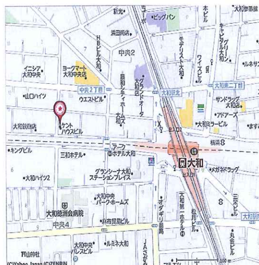
小田急線 相鉄線 大和駅より徒歩5分

給 与: 時間給、随手当、有給休暇を含む総支給額 福 利 費 等: 健康保険、介護保険、厚生年金、雇用保険、労災保険、健康診断等 会社運営費: 人件費、オフィス、事務経費、募集広告費等会社運営にかかる諸経費 営 業 利 益: 上記経費を差引いた会社の利益