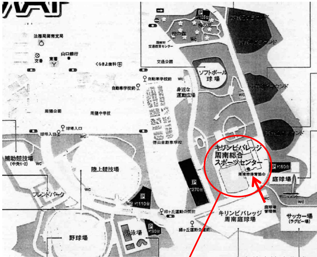
周南市体育協会作成図面より掲載