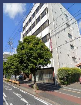
《 外 観 》