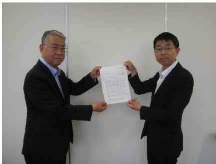
【宇部商工会議所 様（要請書手交の様子）】