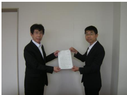
【山陽商工会議所 様（要請書手交の様子）】