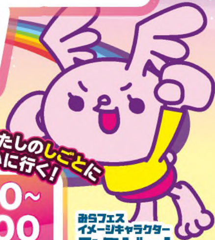
みらフェス イメージキャラクター みらビット