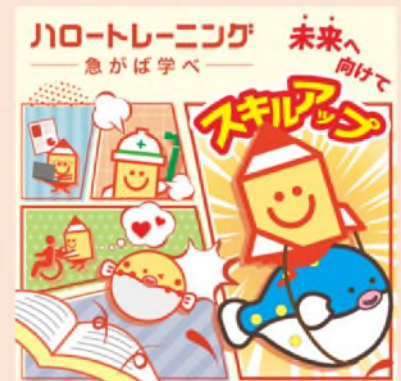
令和6年度「ポスター部門」 最優秀賞受賞作品