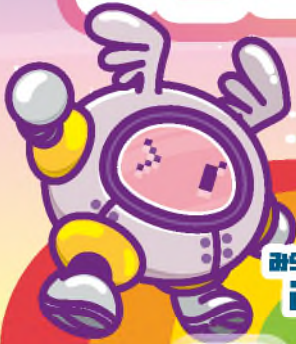
みらビットのともだち みらロボット