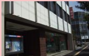
《 外観 》